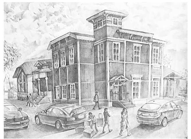
Картина — победитель межрегионального конкурса «Вокзал моего города»

— Больше всего нравится рисовать людей, люблю ещё лепкой заниматься, хочу стать архитектором... — вытгивает из себя девушка, когда я уже чувствую своё бессилие перед её стойким молчанием.