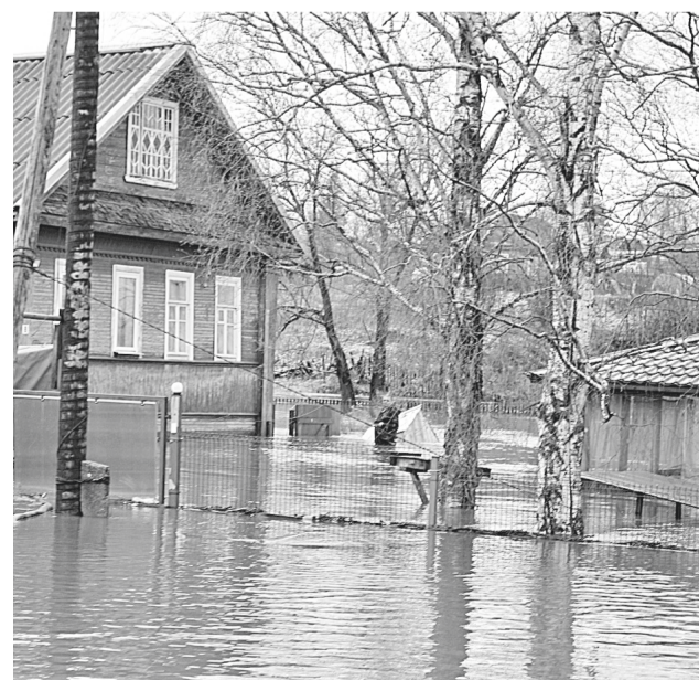
В деревне Тини в пик половодья