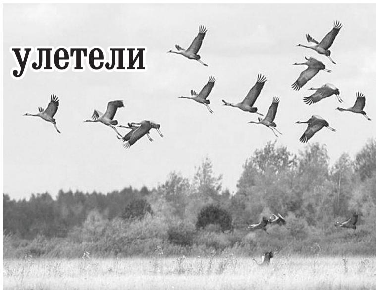
Журавли у озера Крюково.

Журавли любят боровичскую местность. Здесь есть удобные озёра и болота для птичьих гнездовий. Тут они выводят потомство. Например, жители Тухуна любовались этим летом, как взрослые журавли учили летать маленьких