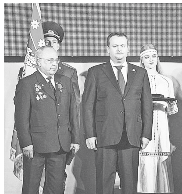
Александр Валетов получает награду от губернатора Андрея Никитина